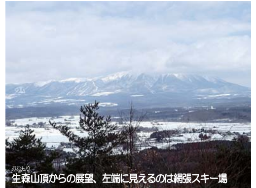
おおもりの 生森山頂からの展望、左端に見えるのは網張スキー場

雫石町役場より東、国道46号線の北側に「七つ森」と呼ばれるぼこぼこした小山があります。現在は豊富に木々が生き茂っていますが、明治42年に国有林から雫石町に払い下げられた際には、買取りの代金にあてるため森の全ての木々が伐採されたそうです。以後、多種に渡る植樹や歩道の整備等を経て、ハイキングを楽しめるスポットに生まれ変わりました。実際に自然観察をしながら生森山頂まで登ってきましたが、往復でも所要時間は1時間もかからず、ほどよい軽登山でした。山頂からの眺めは、『雫石十四景』に選ばれているだけあって、岩手山や駒ヶ岳を望むパノラマは雄大で一見の価値がありました。