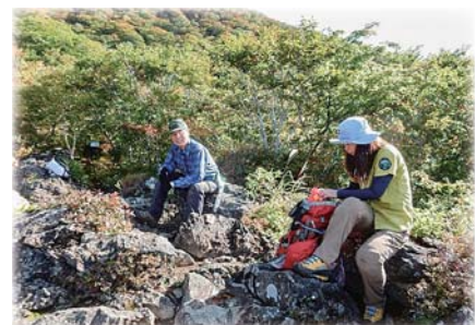
パークボランティアの方々には 沢山のことを教えてもらいました・・・